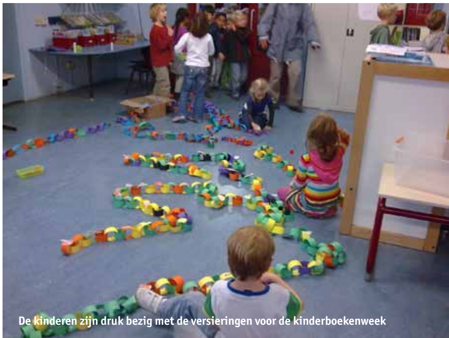
De kinderen zijn druk bezig met de versieringen voor de kinderboekenweek

Het thema is dit jaar: 'Aan tafel!! Eten en snoepen in kinderboeken'. Als rode draad gebruiken wij dit jaar het boek van Roald Dahl: Sjakie en de chocoladefabriek. Een aantal leerkrachten zijn naar de workshop 'Boekhappen' van de SKVR geweest, waar ze veel inspirerende lessuggesties hebben ontvangen!