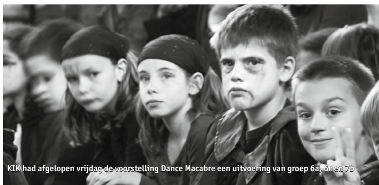
KIK had afgelopen vrijdag de voorstelling Dance Macabre een uitvoering van groep 6a, 6c en 7b