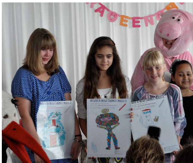
De nummers 1, 2 en 3.